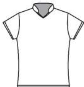
スタンドカラーゲームシャツ