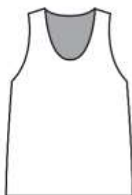
タンクトップ (ランニング) シャツタイプ