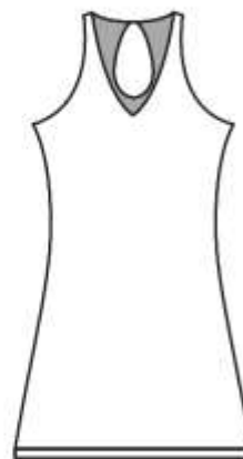
肩や背中が大きく カットされている ワンピース等の ゲームウェア