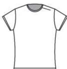
Tシャツタイプ (襟なし) ゲームシャツ