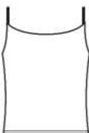
キャミソールタイプ