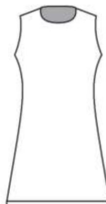
女子のみ ワンピース (襟なし) ゲームウェア