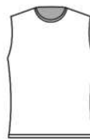
女子のみ ノースリーブ ゲームシャツ