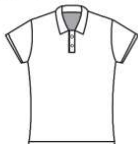
襟付きゲームシャツ