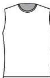
男子のみ ノースリーブ ゲームシャツ